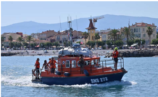
Parade de la mer