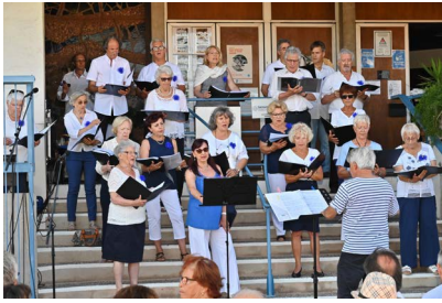
Chorales de la ville