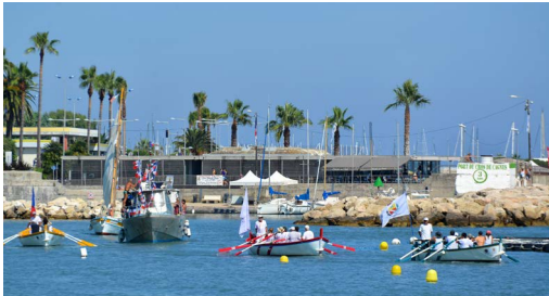
Parade de la mer