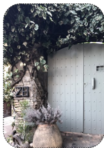
09 Les clôtures