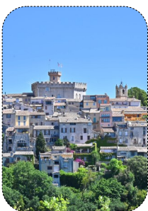
01 Les façades enduites