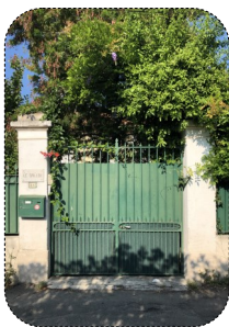
08 Les feronneries