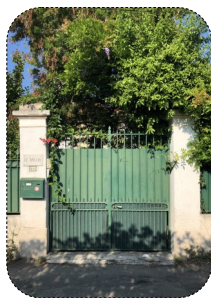
08 Les feronneries