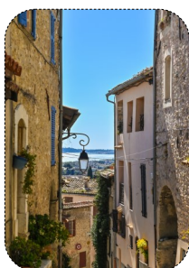
17 La couleur