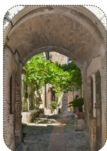
18 Les palettes de couleurs