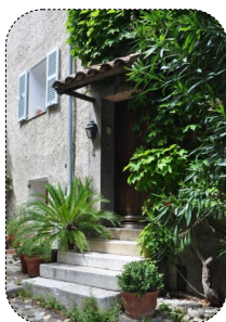
10 Devant la maison