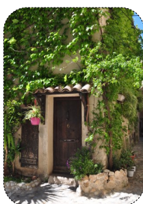
07 Les portes