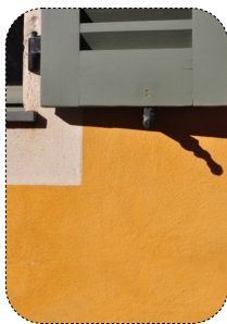
02 Les finitions d'enduits