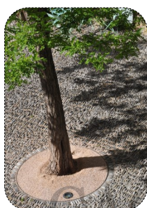
11 Pavages et calades