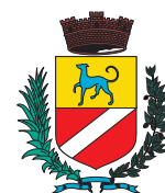
Ville de CAGNES-SUR-MER

© 2012 - Conception : ACS MTE Tous droits réservés.